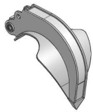
PALA PIENA "C"