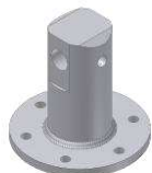
MA - M