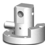
GM - F