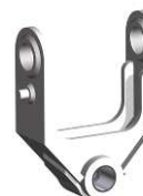
MA - MF