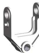
MA - MF